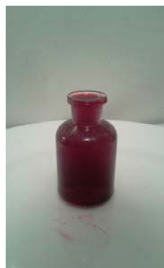
obr. vlevo- voda obarvená potravní barvivem (teplota místnosti)

Obrázky níže ukazují, že led ( s teplotou nižší než 4 °C) má větší objem než voda a tak jeho hustota je menší než hustota vody (máme stále stejnou hmotnost vody). Proto led na vodě tedy částečně plave (a kostky ledu ve whisky též ☺).